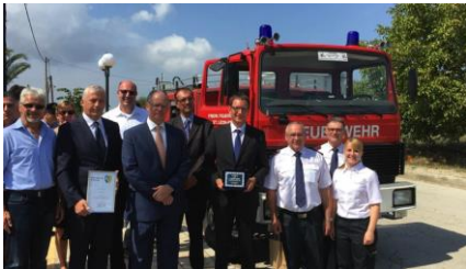
Die offizielle Übergabe des Feuerwehrfahrzeugs