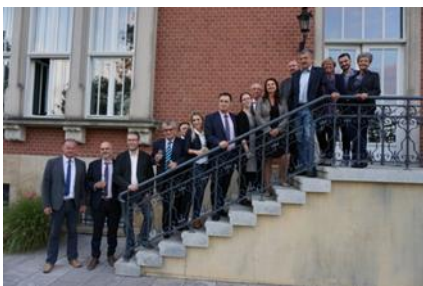
Die griechischen und deutschen Partner