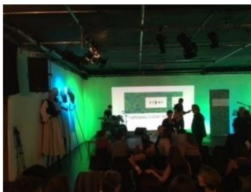
Ein bunter Abend in der Kulturbrauerei Berlin

In einer ersten Phase werden die Fellows in verschiedenen Kulturinstitutionen in ganz Deutschland zwei Monate hospitieren und anschließend in Griechenland eine Projektdurchführungsphase starten. Das Stipendienprogramm fördert die kulturelle Innovationskraft sowie die internationale Vernetzung der jungen Griechinnen und Griechen.