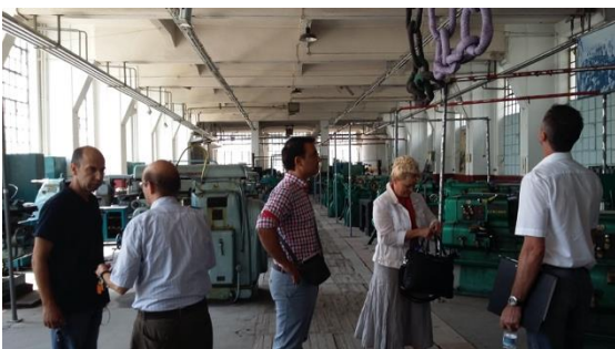
Besuch in der Lehrwerkstatt der Schule Sivitanidios

Außerdem wird die Zusammenarbeit mit einer Berufsschule in Leverkusen und der HWK Münster im Rahmen des Erasmus+Programms vorbereitet. Darüber hinaus wird von Seiten des DVS-Vertreters geprüft, ob und in welcher Form eine Zusammenarbeit mit der Gesellschaft für Schweißtechnik International (GSI) Oberhausen möglich ist.