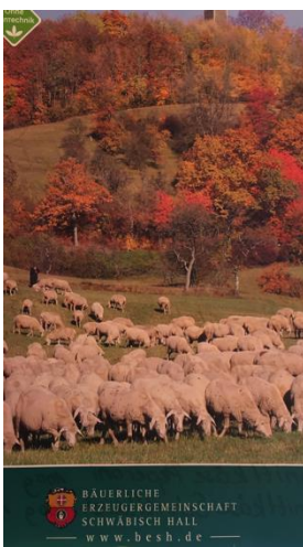
Gemeinsame Vermarktung landwirtschaftliche Erzeugnisse aus der Region