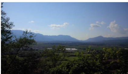
Die Region Epirus verfügt über viele landwirtschaftliche Anbauflächen