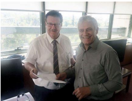
PStS Fuchtel und Umweltminister I. Tsironis