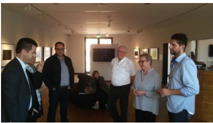
Haus der Fotografie Max Hüntten