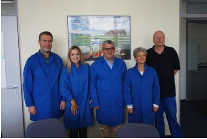
Auch der Besuch einer Molkerei stand auf dem Programm