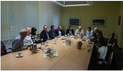
Gespräche mit der Kommunalverwaltung