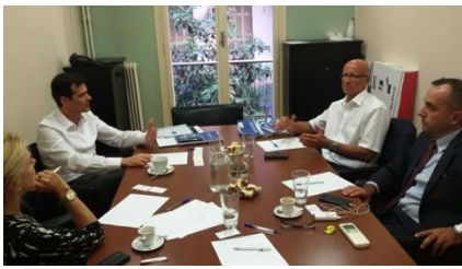
Im Bürgermeisterbüro der DGV Athen