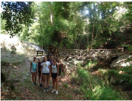
Gemeinsame Wanderungen verbinden