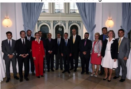
Die gesamte Delegation