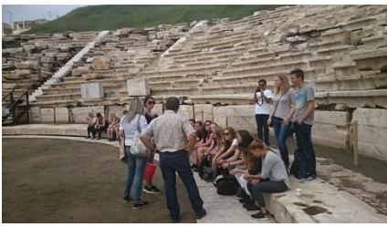
Im Antiken Theater von Larissa