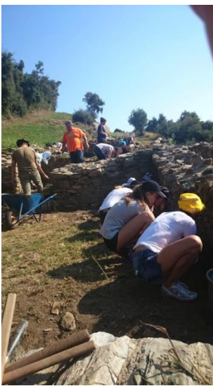
Bei den Ausgrabungen an der Burg