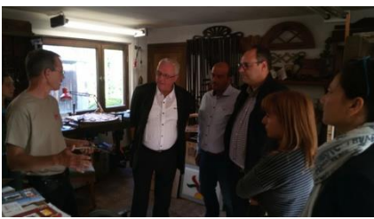
Prerow Darßer Türen