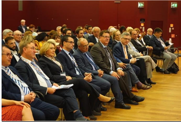
Einblick in das Auditorium