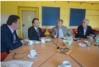
Gespräche mit dem Goethe-Gymnasium in Demmin

Ein weiteres Thema des Arbeitsbesuches war die Kooperation der Kammern. In der IHK Neubrandenburg tauschte sich die Delegation mit Präsident Dr. Blank und verschiedenen Unternehmern aus dem Landkreis aus. Es ging darum, wie die lokalen Produkte, u.a. Wein und Olivenöl, der zehn bewohnten Inseln stärker als ein Markenzeichen präsentiert und mit dem lokalen Tourismus vermarktet werden können, z.B. Direktverkauf und Verköstigungen auf Weingütern oder bei Olivenproduzenten. Die griechischen Partner wurden dazu eingeladen, ihre Produkte auf Messen im Landkreis zu präsentieren. Für den Absatz der griechischen Produkte spielt die Zertifizierung eine große Rolle. Auch für das Thema Berufliche Ausbildung ist die IHK ein fester Partner.