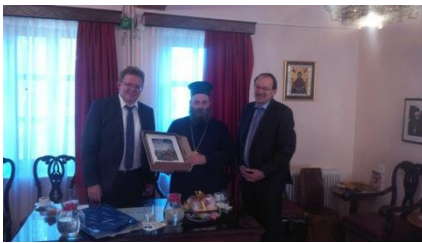
Beim Metropoliten Maximos

Landwirtschaft Regionale Partnerschaft Wandertourismus