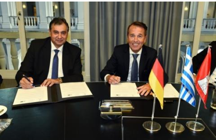
Die Unterzeichnung der Kooperationsvereinbarung