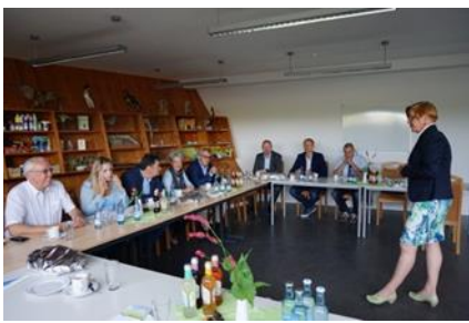
Im Müritzeum in Waren