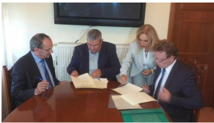
Die Kooperationsvereinbarung wird unterschrieben