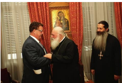
Besuch bei Erzbischof Hieronymus