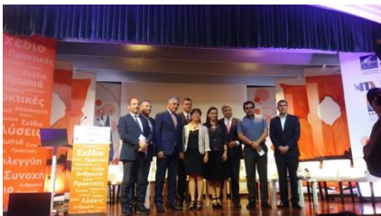
Die Diskussionsteilnehmer des Themenblocks