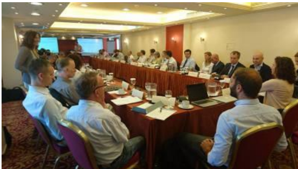
Gegenseitiger Austausch und Wissenstransfer hinsichtlich einer nachhaltigen wirtschaftlichen Entwicklung dienen auch einer langfristigen Erhöhung der Lebensqualität für die Inselbewohner.

Die Deutsch-Griechische Versammlung unterstützt ein Projektkonsortium mit dem Leadpartner MARIKO GmbH und dem Zentrum für Forschung und Technologie Griechenland (CERTH). Der Projektantrag „ModuFuel: A modular LNG fuel system for Multimodal Waterborne Transport“ (siehe FB 13) hat erfolgreich die erste Antragsphase durchlaufen.