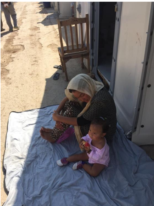
Jeder Schattenplatz wird genutzt