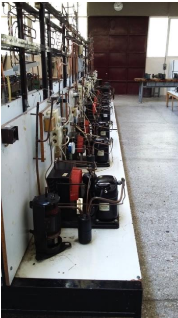
Kältetechniklabor der OAED-Berufsschule in Athen

Energietechnik Ausbildung Tourismus Stadtentwicklung Abfallwirtschaft