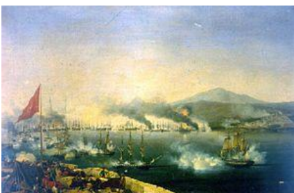
Seeschlacht von Navarino, Gemälde von Ambroise Garneray