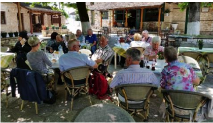
Die Reisegruppe während einer Pause auf dem Dorfplatz im Gespräch mit orthodoxen Priestern