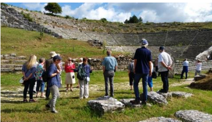
Die Region Epirus ist reich an Kulturzeugnissen