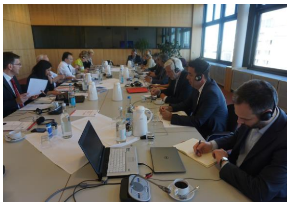
Arbeitssitzung im BMZ