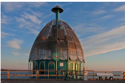
Die Tauchgondel Zinnowitz