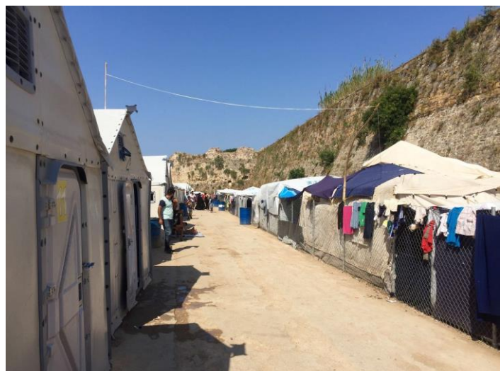
Eine lange Reihe von Zelten bildet die Unterkunft von 1000 Menschen in Souda